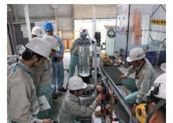
T&C サポートセンターにおける実技研修

当社は、水処理プラントに関わる技術教育と人材育成を担う部署として、T&C (Technical & Career) サポートセンターを設置しています。当社および国内グループ会社ならびに海外の現地社員を対象に研修を実施し、グループ全体の技術教育と安全教育を統括しています。本社で行う講義のほか、山口事業所において実装置を用いた実技研修を行い、クリタグループの安全と品質をグローバルに展開する役割を果たしています。